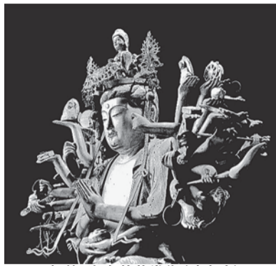
千手観世音菩薩坐像(瑞泉寺)

「佛さま写真観・山門」が4月8日鎌倉に開館する。40数年前から撮り続けた鎌倉市内約50カ所の仏像150余を紹介。