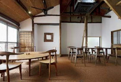
会館。参加無料・要事前申込(先着15人)。申し込み・問い合わせ 戸井田工務店 ☎0467-24-7777 info@kamakura-standard.com

戸井田工務店 企画の連続セミナー。今回の第1部では暮らしの快適性をあげるヒントを住まいの専門家の立場から紹介する。来月の第2部以降ではファイ