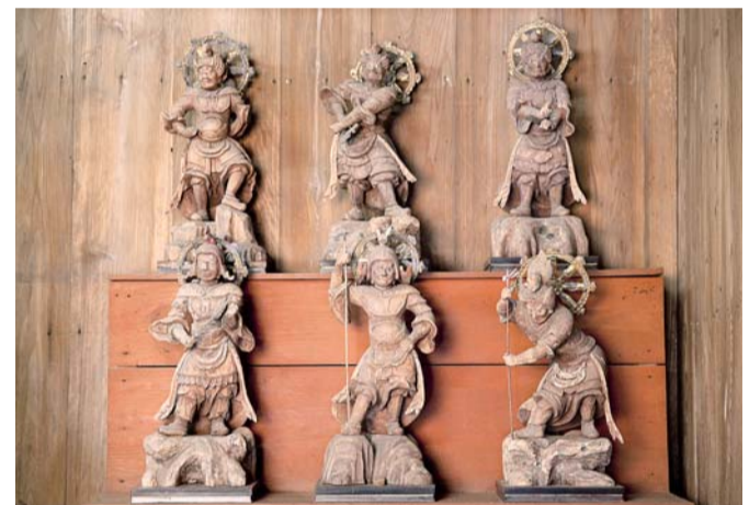
十二神将のうち6体

7月のスーパー猛暑もどくへや、雨ばかりの8月に青空が恋しい今日この頃です。連日の施設朝、拝観時間の少し前、扇谷海蔵寺さまを久しぶりに訪ねました。水の寺とも称される海蔵寺には清らかな井戸や池泉庭園、静寂な境内には季節の花々が自然に美しく咲いています。みほとけ紀行 (74)