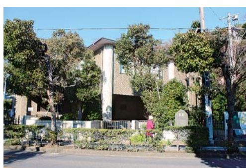
保育所が新設される横濱地方方法務局鎌倉出張所跡地

鎌倉市は、認可保育園に入れられない待機児童解消に向けた取り組みとして、横濱地方方法務局鎌倉出張所跡地に新たな保育所を開設し、第二子以降の保育料を無償化する考えを年頭に示した。市議会2月定例会に2018年度当初予算案として提出し、4月からの実施を目指す。 倉市は昨年10月に管理者の関東財務局から土地(1,633.3㎡)と建物(延べ床面積767.5㎡)を借りる契約を締結。昨年11月から12月にかけて事業所を募集した。今年3