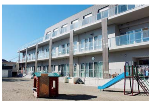
昨年11月開所した由比ガ浜子どもセンター

鎌倉市関谷の畑の一角で玉縄桜が咲き始めたII写真。昨年より10日ほど早く、1月10日ごろ開花した。ソメイヨシノに似た白い花はおよそ1カ月にわたって観賞できる。 玉縄桜は神奈川県立フラワーセンター大船植物園生まれのサクラで、地元有志らが鎌倉・玉縄地域の「宝物」として育てられている。