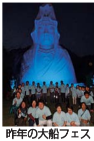
昨年の大船フェス

「世界糖尿病デー」IN大船フェスティバルが11月10日午前12時半から午後4時まで鎌倉市岡本の大船観音寺で開かれる。血糖測定やキノコ汁の