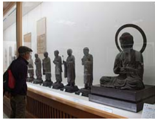
戦時下でも休館することなく、収蔵品の一部を疎開させたり、近隣の社寺などに協力したりして

1928年(昭和3)に開館した鎌倉国宝館(鎌倉市雪ノ下)が、今年で開館90周年になることを記念し、この90年間で大きな試練となった日中戦争から太平洋戦争の時期(1937~1945年)に焦点をあてた特別展が12月2日まで開かれているII写真。 戦時下でも休館することなく、収蔵品の一部を疎開させたり、近隣の社寺などに協力したりして