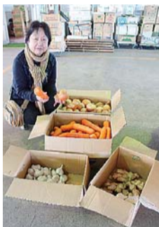
者のために子どもたちの居場所や食事面へのサポートをしようとする市内で臨時の「子ども食堂」を開催している。

＊パワースポットの立ち方 鶴岡八幡宮では先に丸山稲荷社に向かいました。この社は鶴岡八幡宮が頼朝によって現在地に移される遙か前か