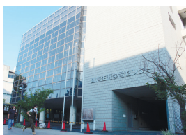
鎌倉生涯学習センター＝8月20日写す

2018年12月から耐震補強工事のため休館していた鎌倉生涯学習センター(鎌倉市小町1丁目)の工事が完了し、10月1日から再開する。市では「利用者等の安全・安心を確保するため、ガイドライン等を踏ま