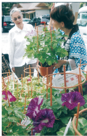
かまくら朝顔=2007年鎌倉宮で

当時、鎌倉の年間観光客数は延べ2400万人に達していたので更なる人波に行政が頭を抱えたのも無理はありません。鶴岡八幡宮の社務所も、撮影に関する条件などで厳しいコメントを寄せています。『ブラウン管に現代の八幡宮をタブララせて流される、これは困ります。当時は社殿へ登る石段の直なところ複雑な心境でわきに杉の太木があったという記録がない。そのへんをわきまえてくれな」と困る」