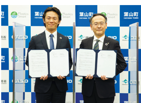
葉山町とカシオ計算機「マート」での提携第1号(本社・東京都渋谷区、として「プラスチックご