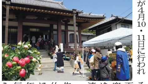
奈良時代から続く葉山最古の古刹・玉蔵院(葉山町一色)で仏陀の誕生