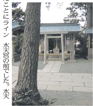
森戸神社の中の水天宮