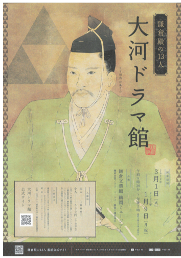
鎌倉殿の13人 大河ドラマ館 3月1日～1月9日 鎌倉文華館鶴岡ミュージアム