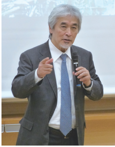
総合地球環境学研究所所長の山極さんが講演

鎌倉女子大学(鎌倉市)が、今年創立80周年を迎え、記念事業として学内外の優れた研究者を招聘し、10月から12月にかけて各分野で5回の講演会を