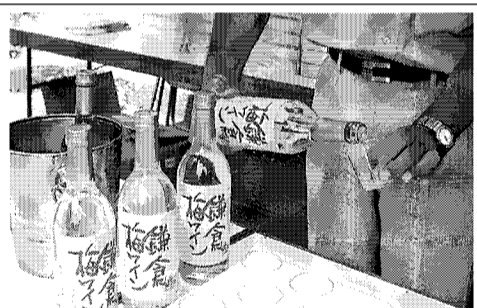
「梅ワイン」の旗を振り、酒販店の目印にしている。JR鎌倉駅西口で9月上旬、試験キャンペーンをした。ミス鎌倉も出て、通りがかりの人たちにサ

「おいしい梅ワインがで、きました」鎌倉の新しい特産品として昨秋、誕生した梅ワインが、今年も市内各所で発売されてお