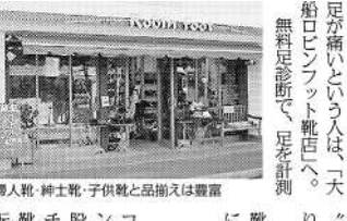
無料足診断券。足のカルテプレゼント。